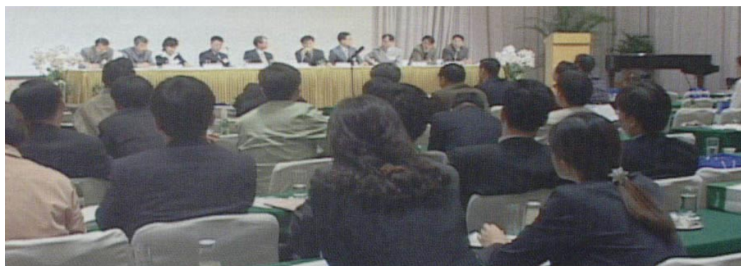
대한신경과개원의협의회 창립총회 및 심포지움 (신라호텔)

신경과 개원의가 늘어나면서 학회에서 적지 않은 비중을 차지하게 되었고, 신경과 개원의로서의 고립감, 의료보험 수가로 인한 현실적인 문제들, 학회나 다른 곳에서 나눌 수 없었던 서로의 어려움과 새로운 정보를 함께 나눌 수 있는 교류의 장이 필요하다는 공감대가 자연스럽게 형성되었다. 개원의협의회 준비위원회가 2002년 2월 24일 결성되고 3월 31일 창립총회를 하면서 대내외적으로 대한신경과개원의협의회가 공식 발족되었다.